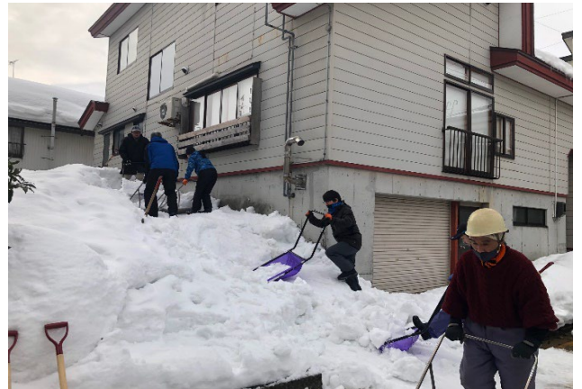
～積み上がった雪を流雪溝に流す隊員～