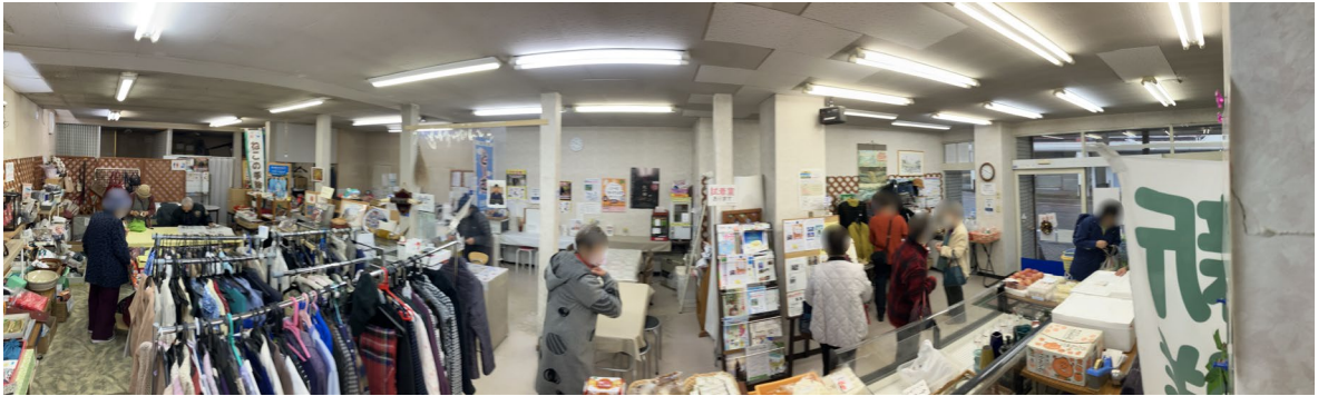
買い物を楽しむ来場者の皆さん